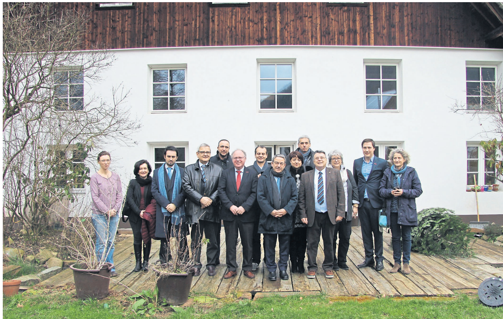
Am Beispiel eines Schwarzwaldhofes erfuhren die Gäste aus Padua die besonderen Aspekte der Gebäudesanierung in der Region.