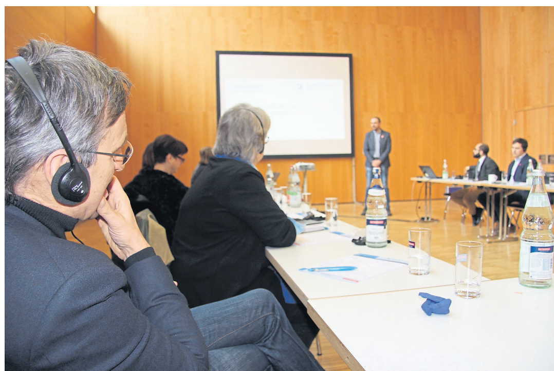
Intensiver fachlicher Austausch beider Kammern.