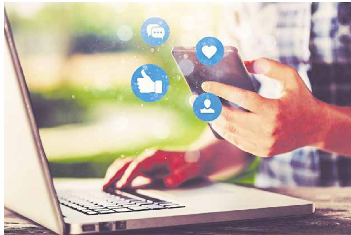
Die Adverts-Talkrunde zu Personalthemen findet virtuell statt.