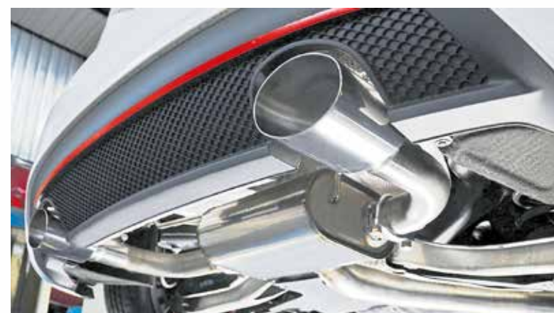
Die „Aktive Veredelung“ von Fahrzeugen Schweizer Kunden ist ein Fall für den Zoll. Mit einem Dienstleister können die Betriebe von Erleichterungen beim Verfahren profitieren.

Seit dem Jahr 2018 ist das Thema „Aktive Veredelung“ insbesondere für Kfz-Werkstätten im Dreiland wesentlicher Bestandteil der täglichen Arbeit. Der Grund: Die europäischen Zollvorschriften, die die Ein- und Ausfuhr von Fahrzeugen von Schweizer Kunden regeln. Schweizer Kunden, die ihr Fahrzeug in einer deutschen Werkstatt aufwerten lassen wollen, müssen dies nämlich bei der Einreise beim Zoll schriftlich anmelden und zudem eine sogenannte Sicherheitsleistung, also einen Geldbetrag, in Abhängigkeit des Fahrzeugwertes beim Zoll hinterlegen. Darauf muss der ausführende Betrieb den Kunden hinweisen, sonst drohen sowohl dem Fahrzeughalter als auch dem Betrieb empfindliche Strafen. Als besonders komplex und einschränkend hat sich bei diesem „Verfahren der Aktiven Veredelung“ die Sicherheitsleistung herausgestellt. Die zu hinterlegenden Beträge sind meist hoch, so dass einige Unternehmen diese Leistung als Dienstleistung für den Kunden über ein Zollkonto abwickeln. Auch Speditionen und weitere Dienstleister bieten