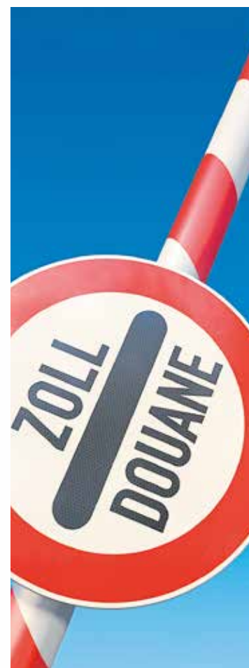
Die Grenzen sollen offen bleiben. Das ist der Tenor der Rückmeldungen auf einen offenen Brief der Handwerkskammer Freiburg.

Der offene Brief rief ein großes Echo hervor: Mehrere der angeschriebenen Bundes- und Landtagsabgeordneten aus dem Kammerbezirk äußerten sich gegenüber der Handwerkskammer Freiburg oder wurden für das Handwerk aktiv. Der Tenor: Über Parteigrenzen hinweg erhielt die Forderung des Handwerks breite Zustimmung und starke Unterstützung. Unter anderem sagte der Grünen-Bundestagsabgeordnete und Präsident des Oberrheinrates Josha